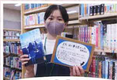
おすすの本のPOPができました。YAコーナーにあります #なさん借りてください