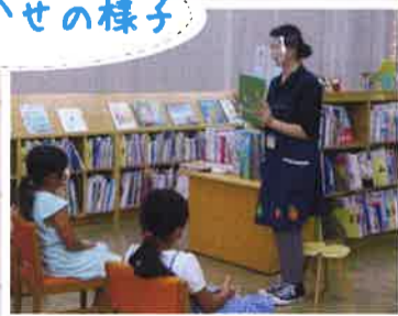
よみきかせの様子