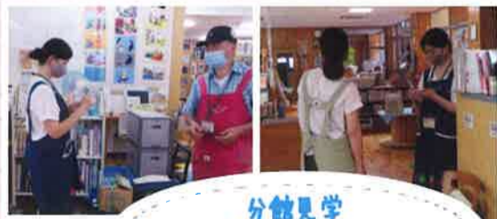
分館見学 メモを取る事が印象的でした