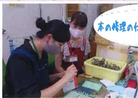
本の修理の仕方を習っています