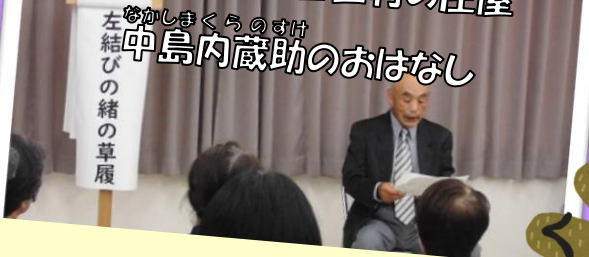
「左結びの緒の草履」