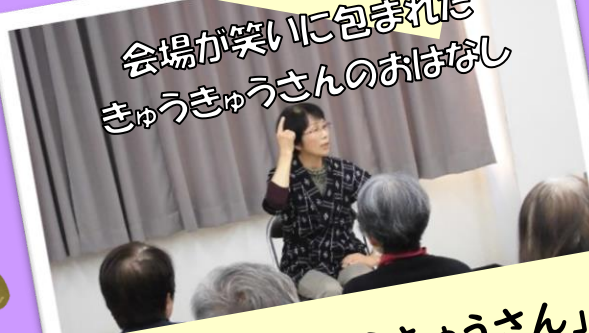
「宅間田のきゅうきゅうさん」