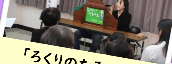
「ろくりのたるべえ」