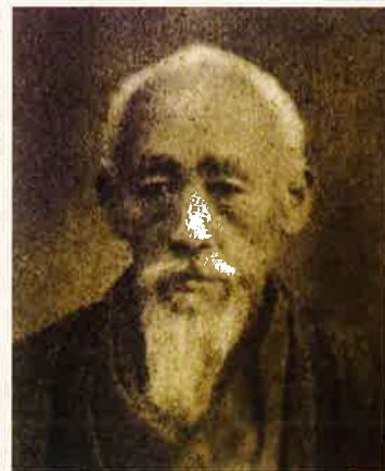
樋口和堂肖像写真